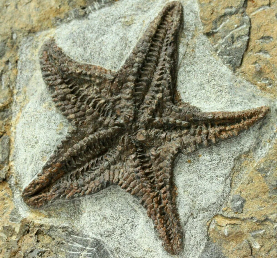
450 milyon yıllık taşlı