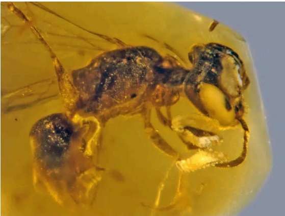
Amber içinde fosili