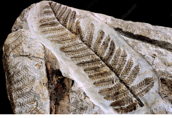
290 milyon yaşımda taşılı