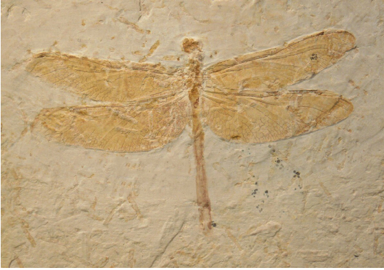
92 milyon yıllık taşlı